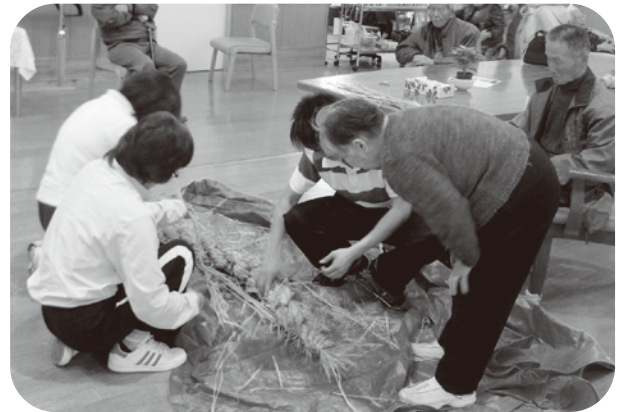
▲スタッフと一緒に大きなしめ縄を作ります。