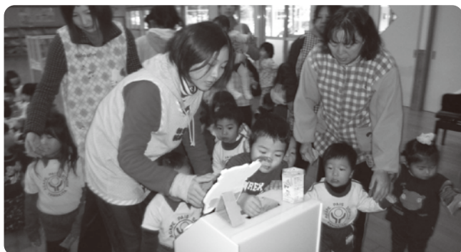
▲園児たち一人一人に募金箱に入れていただきました。

町内の皆様をはじめ、企業や公共機関の皆様、たくさんのご協力ありがとうございました。今回の募金の総額実績と詳細は、別紙の折り込みチラシに掲載しています。