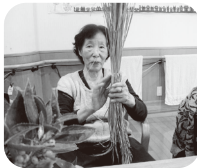
▲わらを束ねています。

毎年恒例のしめ縄作りを行いました。皆さん慣れた手つきで作られました。 また、今年は貼り絵で門松を作成しました。 今年も一年皆さんにとって良い年でありますように！