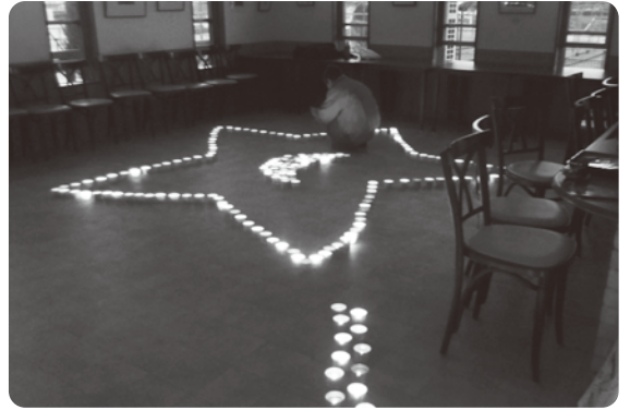
▲今年はるびなすの中にろうそくを並べました。