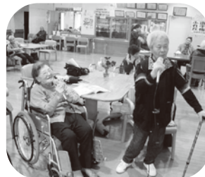
▲お二人でデュエットもされます。

毎月3回程、「カラオケの日」を開催しています。新しいカラオケ機器を導入し、皆さんの自慢の歌を披露されています。