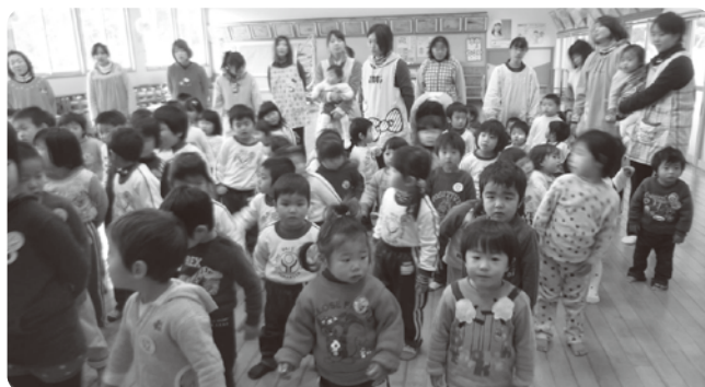
▲園児たちから元気いっぱいの歌のプレゼントもありました。