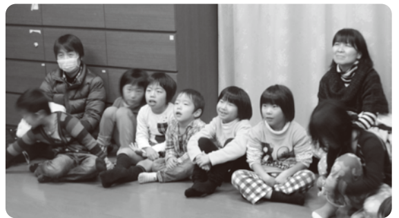
▲静かにお話しを聞きました。