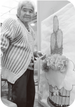
▲何色の折り紙が貼ろうかなあ～