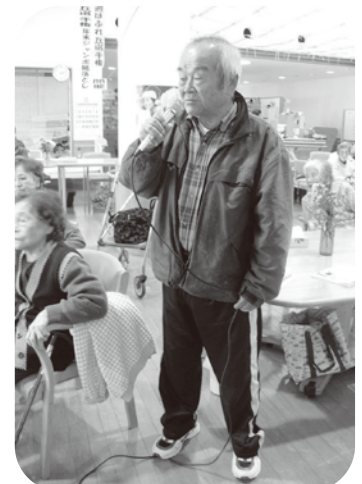
▲得意の歌を熱唱しています。