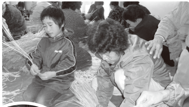
▲おばあちゃんに教わりながらわらづとを作りました。

3日間寝かせて出来上がった納豆は、12月26日(水)に町内の80歳以上の独居高齢者のお宅にお正月用として届けられました。