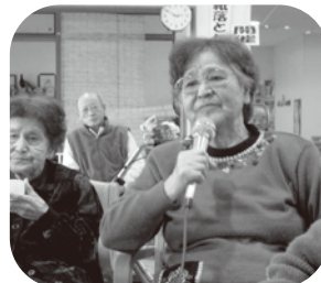
▲いつも楽しく歌われています。