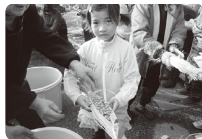
▲わらづとにいっぱい納豆を入れてもらいました。