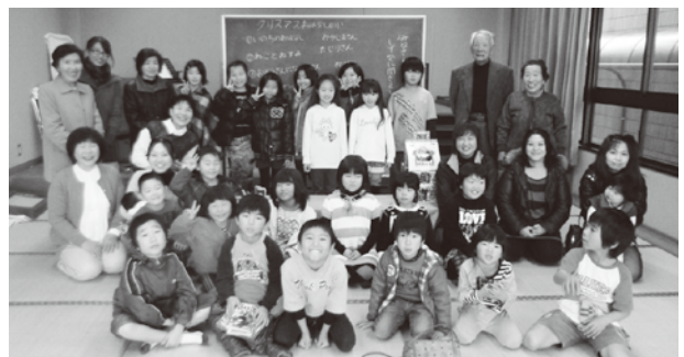
▲たくさんの参加ありがとうございます!