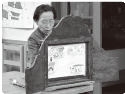
▲たんぽぽの会員によるお話し会。