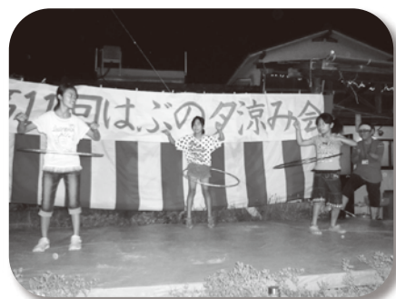
子どもフラフープ大会 よう腰んうごくな~