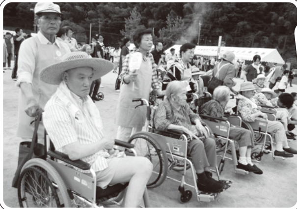
▲葉山苑、グループホームはるの利用者の方とお祭りを楽しみました。