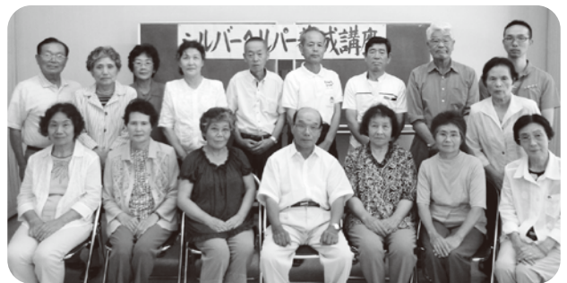
▲ 2日間の講座、お疲れさまでした

7月17日・18日の2日間で、今年もシルバーヘルパー養成講座を行いました。1日目は玉名市で講義、2日目はふれあいの丘デイサービスセンターの見学・実習、その後は認知症サポーター養成講座と盛りだくさんの講座内容でした。今年は13名の方が新たに友愛クラブの一員になられ、今後は各地区の見守り活動や声かけ、サロン活動を行っていきます。