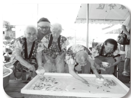
なつかしか~ 金魚すくい