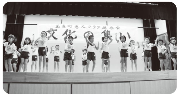
▲ 山北保育園「みんな集まれ! キョウリュウジャー」