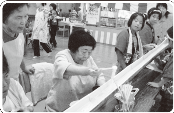
▲様子を見ながら「流しますよ〜!」