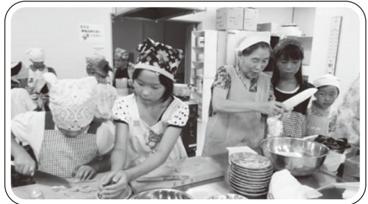
▲おばあちゃんに料理のワザを習います。

久しぶりに子どもさんとふれ合いができて楽しかったです。また参加したいです。(老人クラブ)