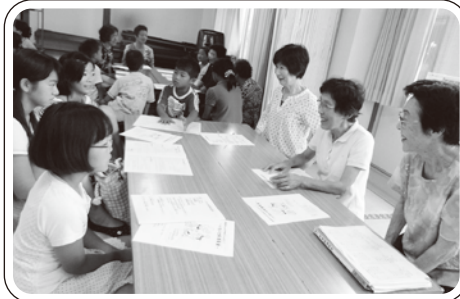
▲グループ内で自己紹介