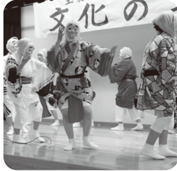
▲ 上木葉老人クラブ「ひよっとこ踊り」