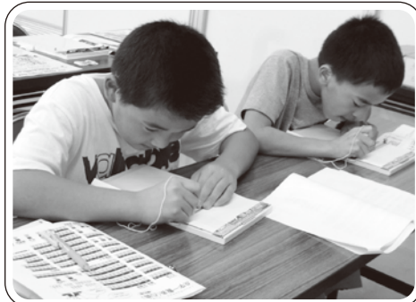
▲兄弟で点字の早打ち競争 「どっちが速く打てたかな?」