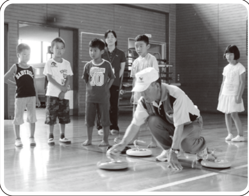
▲おじいちゃんに教わりながら、カローリングに挑戦!