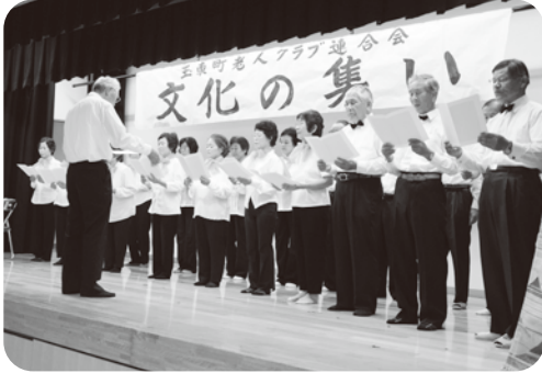
▲ 山口老人クラブ「荒城の月・夕焼小焼」