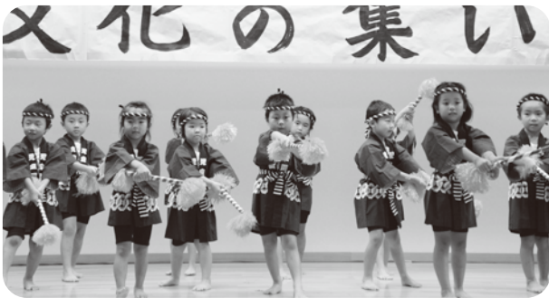
▲ 木葉昭和児童園「やんちゃ船」

今年で25回を迎える老人クラブ連合会主催の「文化の集い」。老人クラブ会員と来賓も含め、約450名の方が参加されました。老人クラブ会員による健康体操やカラオケ、舞踊に詩吟、そして、山北保育園や木葉昭和児童園の園児たちによるアトラクションも含め、43組の出演がありました。会場の皆さんは、個性豊かな出し物に声を上げて笑ったり、園児のかわいく、一生懸命な踊りに感動されていました。