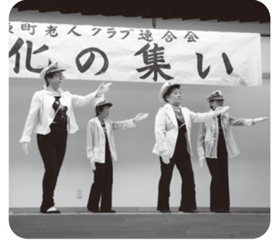
▲ 土生野老人クラブ「同期の桜」