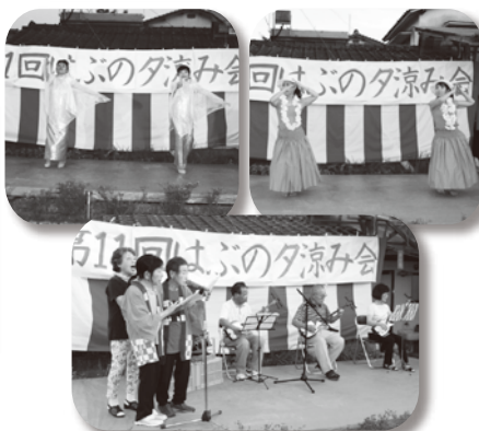
ボランティアの皆様 ありがとうございます 毎年楽しみにしております♪