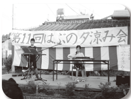
オープニング 子ども大正琴

7月19日(金)18:30より介護ホームはぶの駐車場にて、毎年恒例の夕涼み会が開催されました。今年も、天候にも恵まれ、たくさんの方に来ていただき、とっても賑やかな祭りとなりました! はぶのを支えてくださっている皆様方に感謝!感謝です!