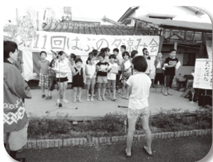
はぶの子ども会の 合唱団も恒例になりました