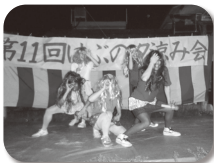
スタッフ余興 ももクロ? 「あ~た、だれな?」