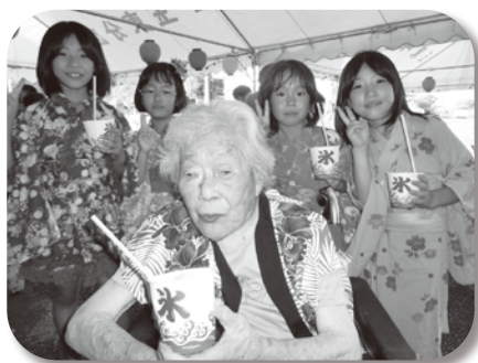
かき氷 おいしかったばい♪