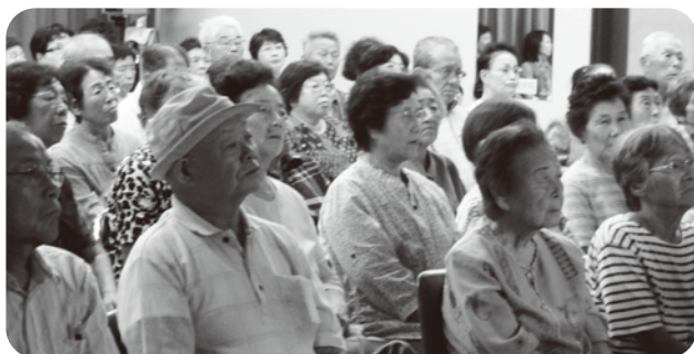
▲ 講師の話を、熱心に聴き入ります