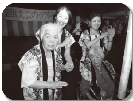
盆おどり 久しぶりに踊ったばい