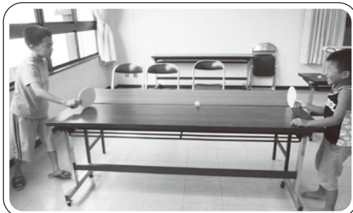
▲目をつむって、卓球に挑戦!! ピンポン玉の中に鈴が入っています。