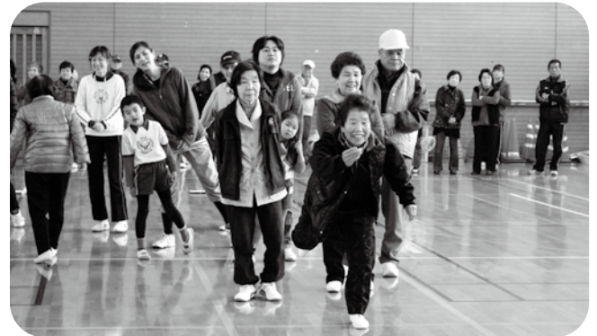
▲子どもたちに負けとられんね〜