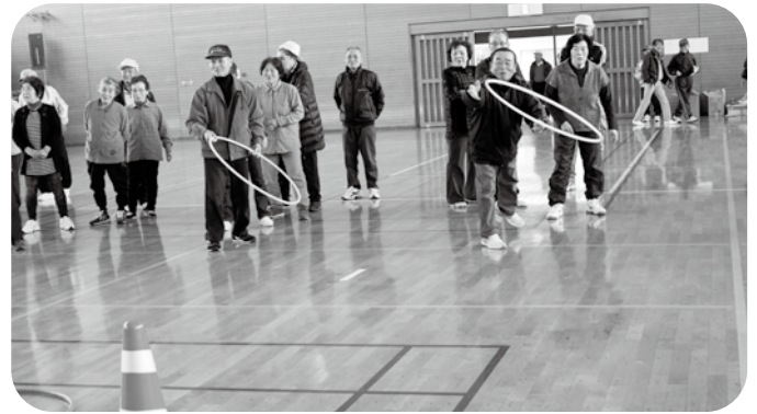
▲三角コーンを目指して「それっ!!」

3月7日、三世代交流のふれあいスポーツ大会を開催しました。木葉昭和児童園、山北保育園の園児と保護者の皆さん、多数の来賓を迎え、玉入れやボール運びなどの競技を行いました。スポーツを通して交流を深め、活気あふれる大会になりました。