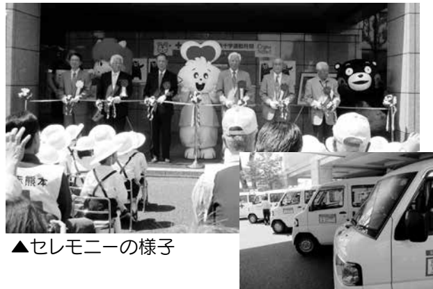
▲セレモニーの様子

「赤十字運動月間オープニングセレモニー」が5月1日に開催され、赤十字運動月間がスタートしました!