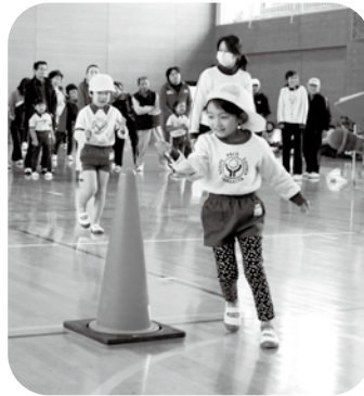
▲お玉のボールを落とさないように慎重に、慎重に