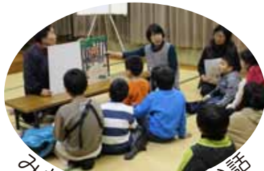
みかん文庫によるお話