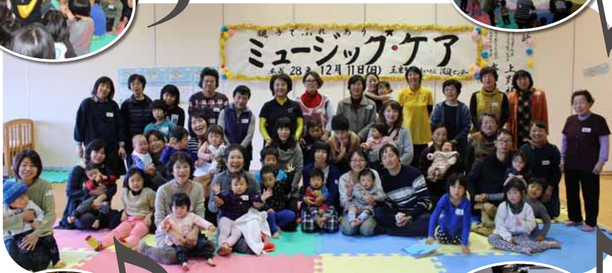
▲参加された親子とたんぽぽの皆さん