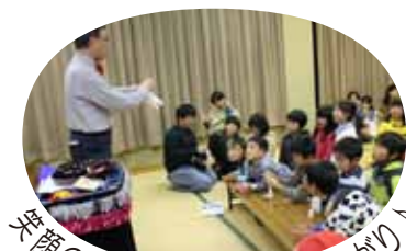
笑顔のたまて箱の手品也大盛り上がり

「笑顔のたまて箱」によるパネルシアターや手品、みかん文庫によるお話会もあり、親子でゆっくりとした時間を過ごしました。