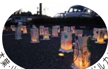
木葉・山北小1年生手作りのキャンドルカバー