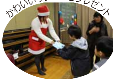
かわいいサンタからプレゼント