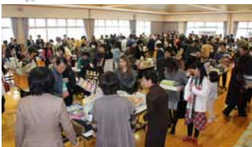
▲昨年のバザーの様子 沢山の品物と人で賑わいます!!