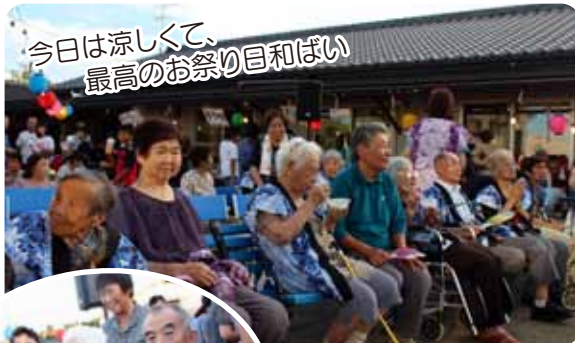
今日は涼しくて、 最高のお祭り目と和ばい