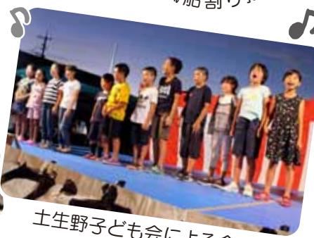
土生野子ども会による合唱