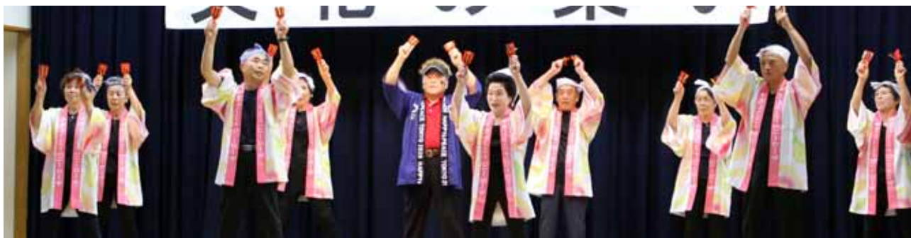
▲上木葉地区の健康ダンス「一笑懸命」