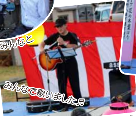
みんなで歌いました月