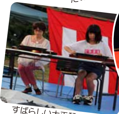
すばらしい大正琴の演奏