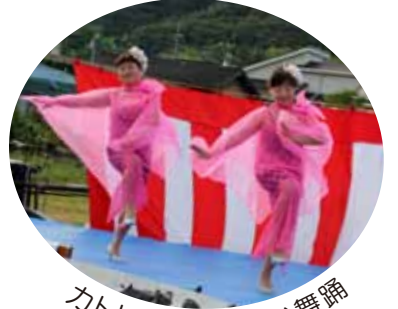
カトリア会の美しい舞踊