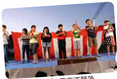
ラップの芯立て競争