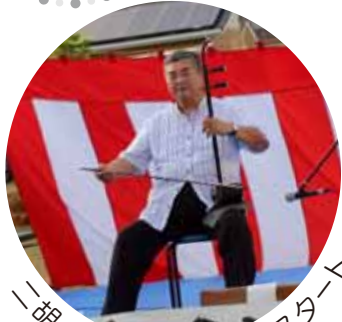
二胡のきれいな音色でスタート