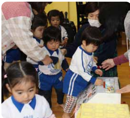
▲山北保育園での募金のようす▼