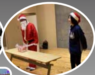
ローソン玉東店よりケーキのプレゼントがありました！