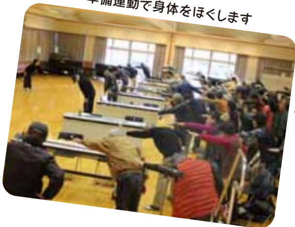
準備運動で身体をほくします