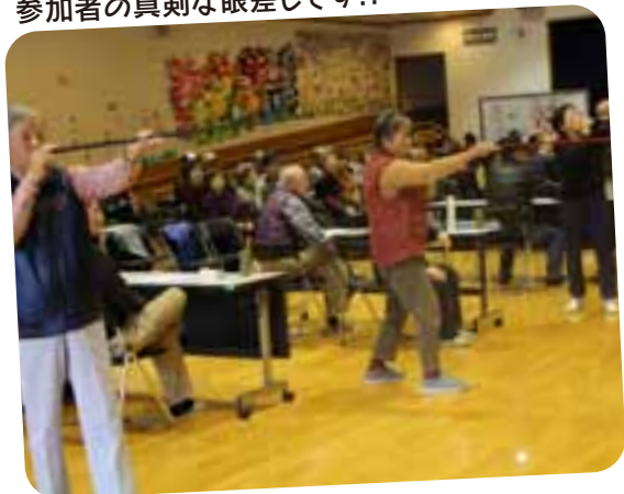
参加者の真剣な眼差しです!!