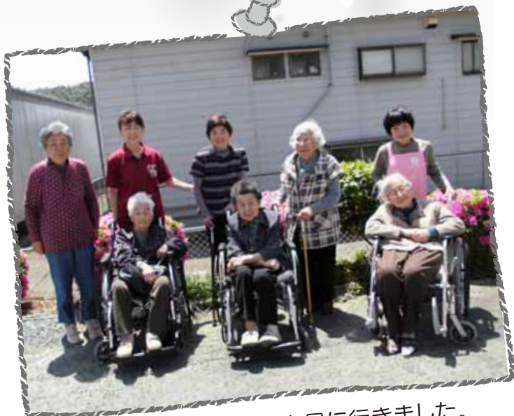
近所につつじの花を見に行きました。