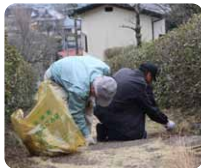
▲階段もきれいにしました。