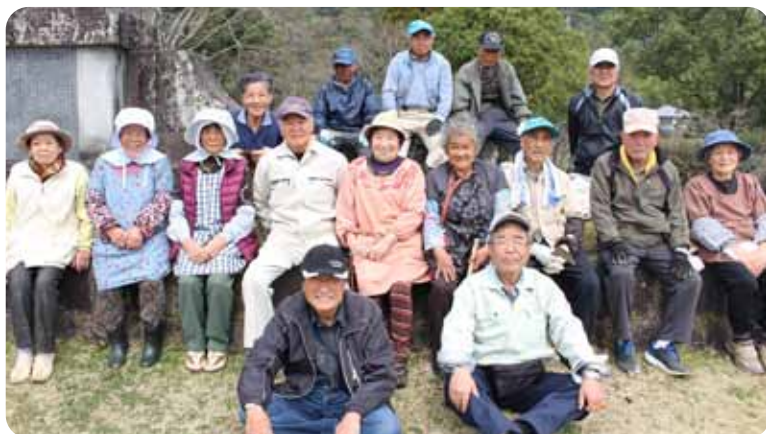
▲参加された皆さん