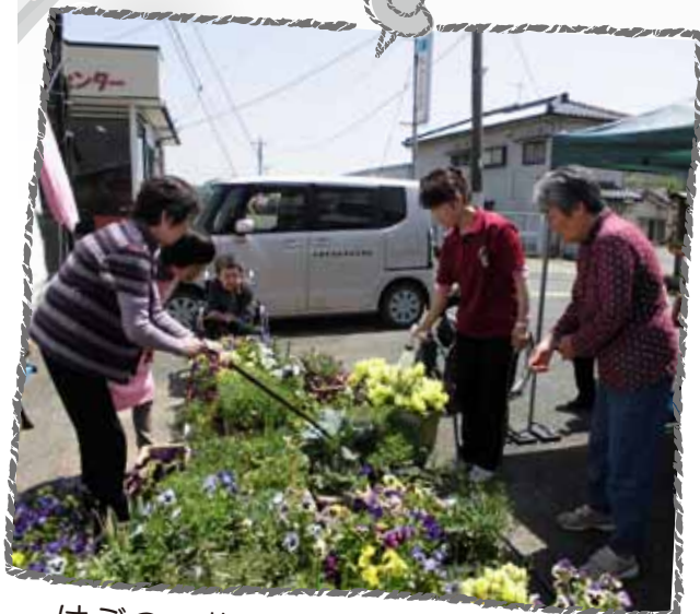
はぶのの花もきれいに咲いています。