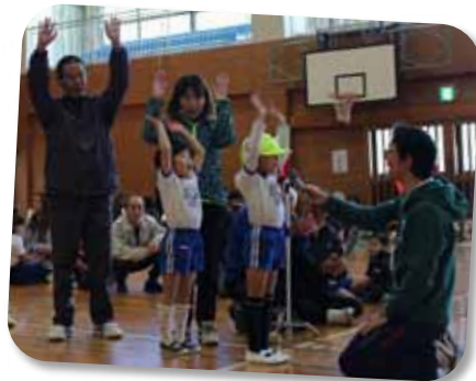
▲バンザイ、バンザイ