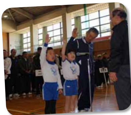
▲大きな声で選手宣誓してくれました。